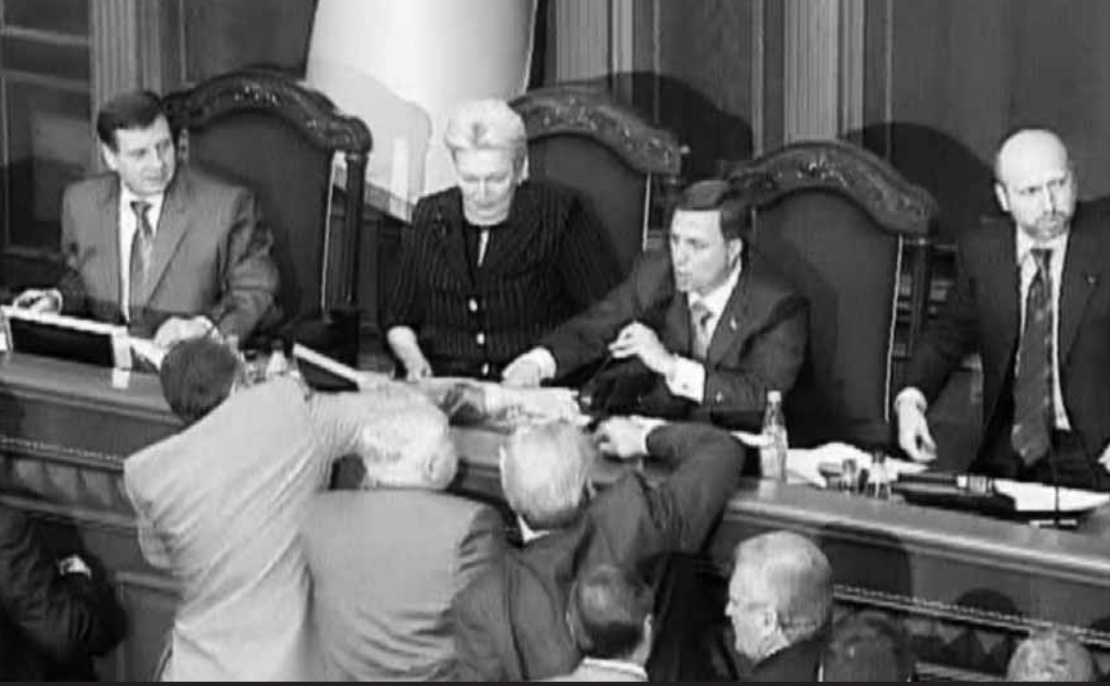
7 червня 2006 року. Головуючи на засіданні Верховної Ради, Микола Катеринчук запобіг об'єднанню Нашої України з Партією Регіонів