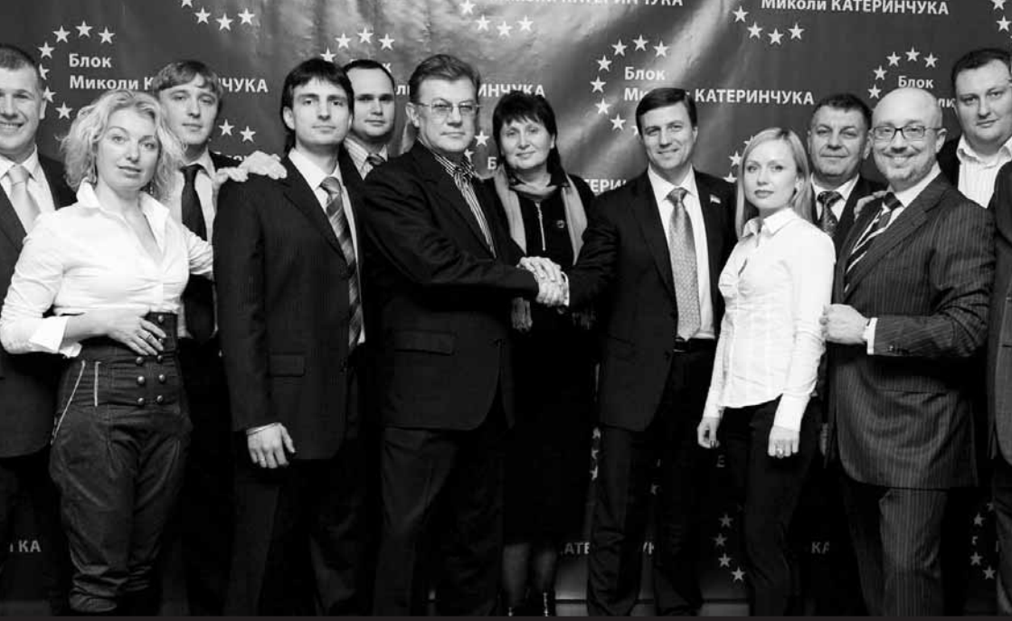
Микола Катеринчук об'єднав навколо себе команду однодумців — економістів, юристів, підприємців. Так виникла Європейська партія України

широкої коаліції відкладено лише тимчасово. Вона не відбулася не тому, що наші лідери цього не хотіли, – просто Мороз випередив, от і все».