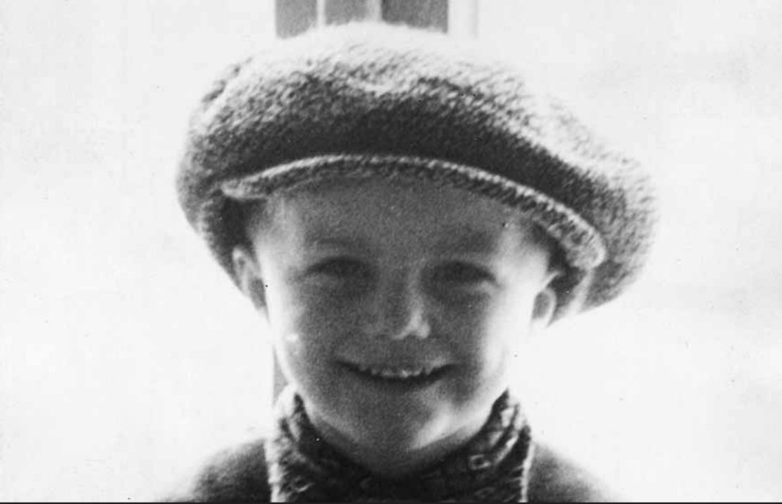
Як будь-який хлопець, Микола в дитинстві був розбишакою