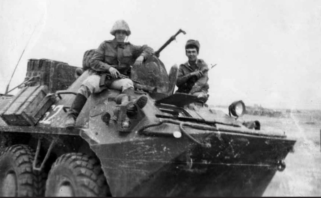
1986 рік. Афганістан. Служба в прикордонних військах