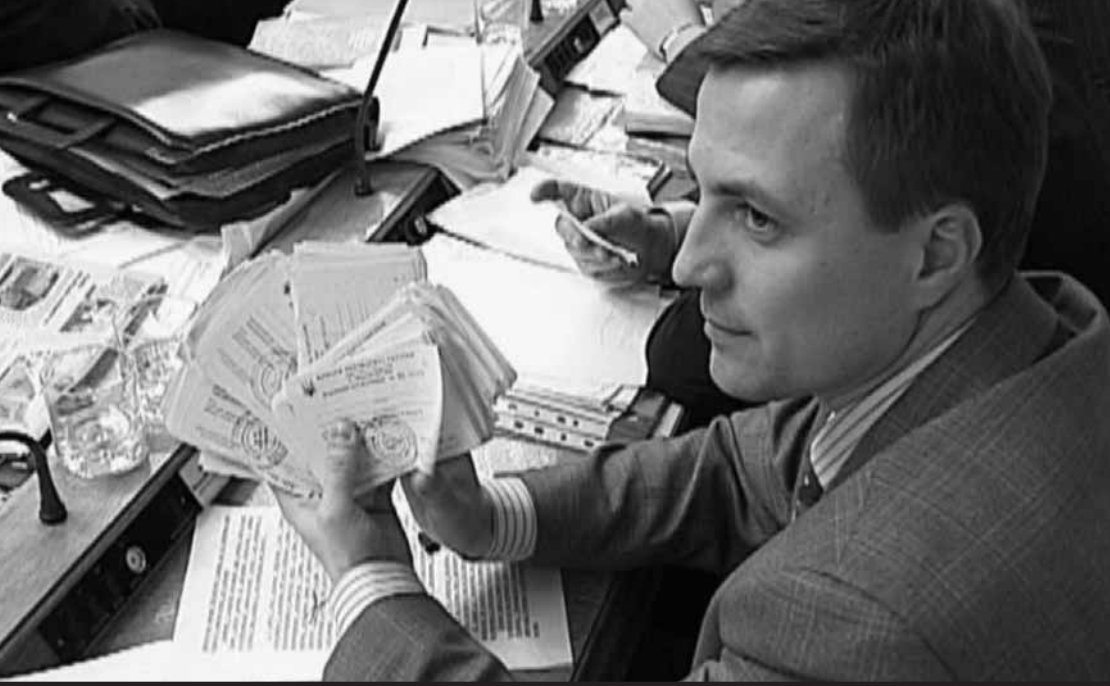
Докази фальсифікацій, зібрані спостерігачами, допомогли виграти справу у Верховному Суді