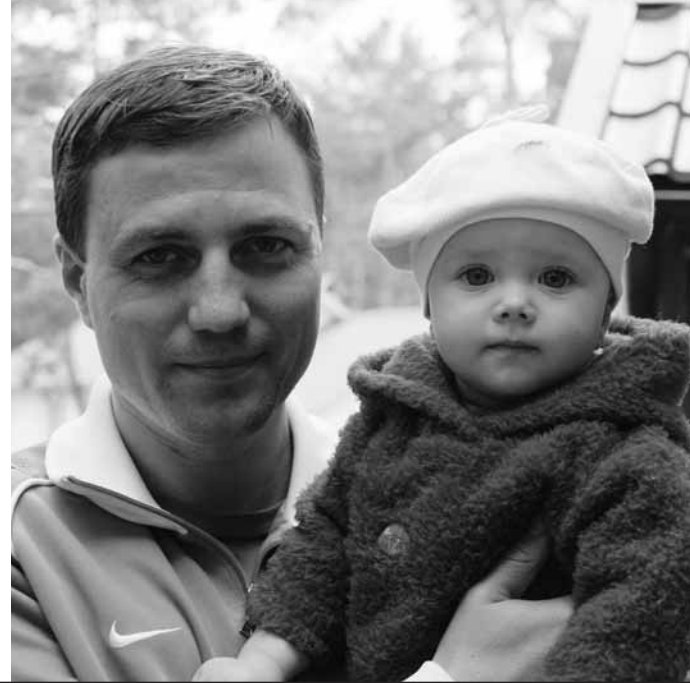
Батько не завжди поруч, але діти постійно відчують його захист